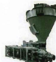
シュビングポンプ