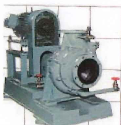
ヒドロスタルポンプ