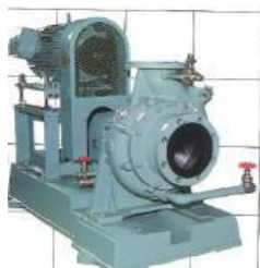
ヒドロスタルポン

スラリーポンプ 用途:高粘度、高揚程、一般化学、工場排水 ・接液部品の材質選定により、あらゆる液体及びスラリーの輸送が可能です。 ・コンパクトで大容量が得られ、効率が優れています。 ・構造がシンプルでメンテナンスが容易です。 主な納入場所:化学工場、製鉄所、発電所