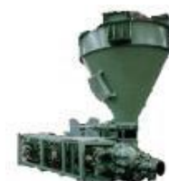
シュビングポンプ

ケーキ解砕 用途:脱水ケーキの粒状化処理 ・脱水ケーキを20mm以下の粒状に連続高速解砕できます。 ・乾燥粉体を添加することにより、高含水率のケーキも粒状化が可能です。 ・コンパクトなため、設置スペースをとりません。